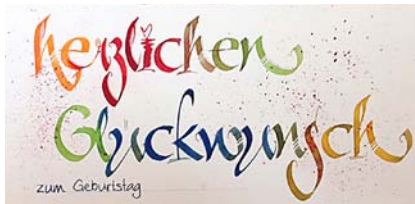
Kurs I: Crazy Letters

Die Materialliste wird jeder Teilnehmerin vorab zugesandt.