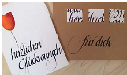
Kurs II: Cancellaresca

ORT Haus Johannisthal | Johannisthal 1 | 92670 Windischeschenbach