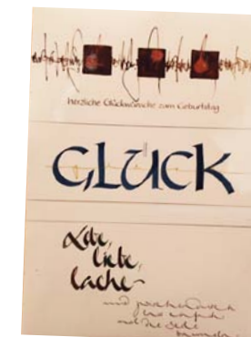
Kurs II: Zieharmonika trifft Klassik

Die Materialliste wird jeder Teilnehmerin vorab zugesandt.