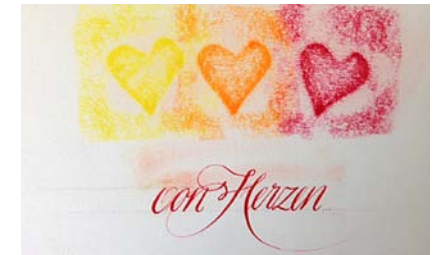
Kurs I: Anglaise