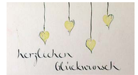
Kurs II: Andrea's Variable