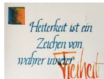
Kurs I: Humanistische Kursive